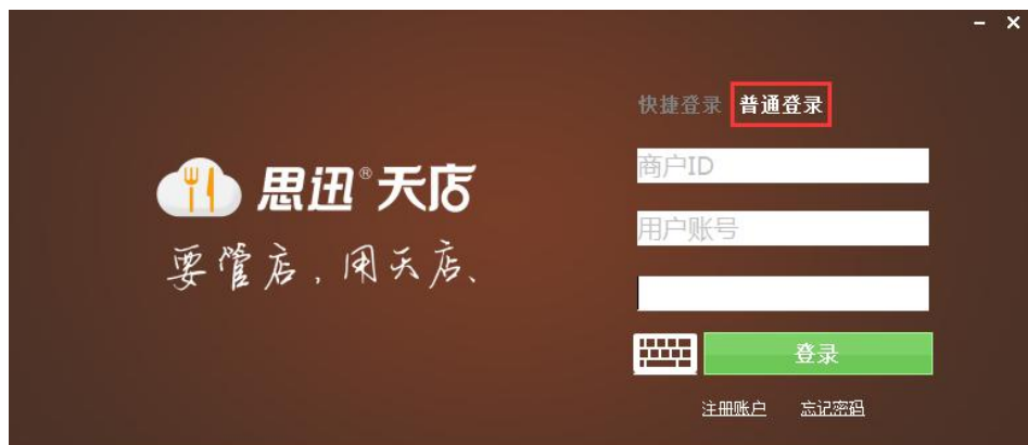
图 5-1-2 普通登录