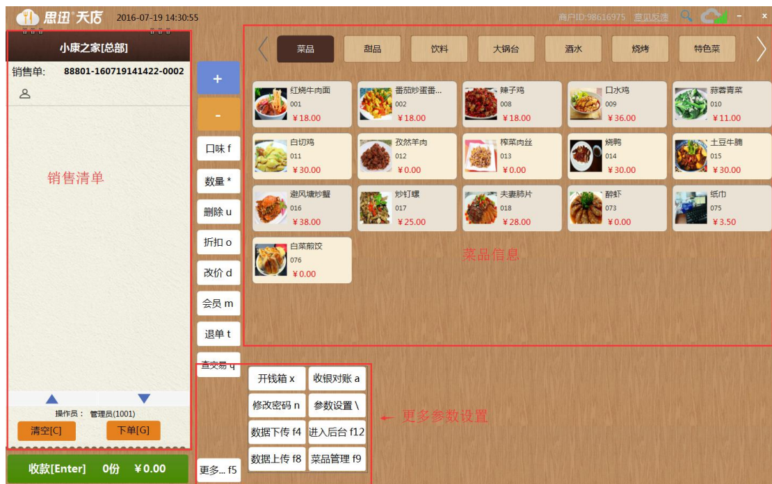
图 5-2-1 客户端页面

登录客户端后，待后台数据下载完毕即可进入客户端页面，客户端页面主要分为“销售清单”，“菜品信息”，“收款功能”三部分。如图 5-2-1 所示；