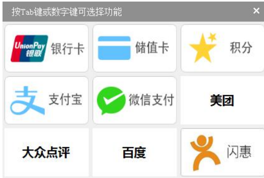
图 5-2-6 更多支付