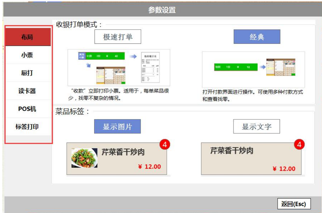
图 5-2-8 参数设置界面

【数据下传】：后台新增菜品档案或者修改数据后需要前台做数据同步，就需要进行“数据下传”操作。