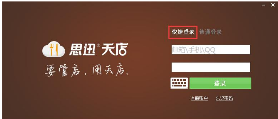
图 5-1-1 快捷登录