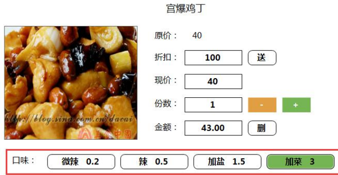
图 5-2-3 口味界面