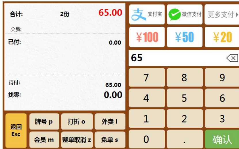
图 5-2-5 收款界面