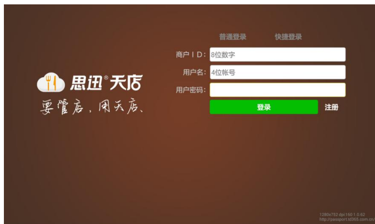
图 6-1-2 普通登录