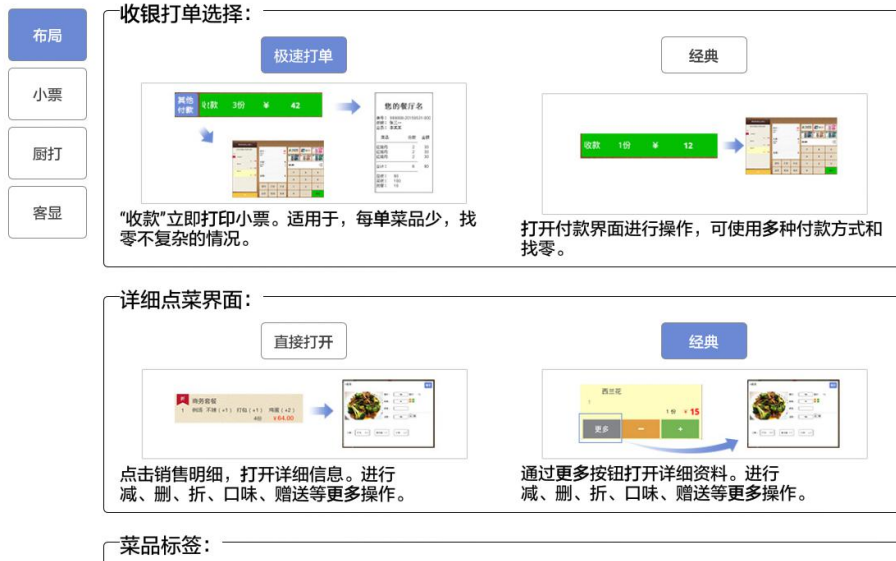
图 6-2-6 设置界面

【断网错误数据查询】：软件可支持断网 72 小时操作，断网所产生的销售数据会先储存在本地，联网之后系统会将本地数据自动上传云端，如无法上传的错误数据会储存在断网错误数据里面，可通过此处查看，手动将数据上传云端。