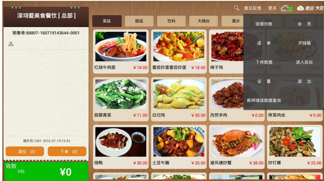
图 6-2-1 客户端界面