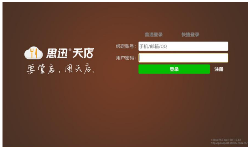
图 6-1-1 快捷登录