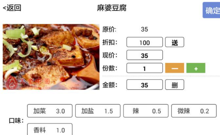
图 6-2-3 更多界面